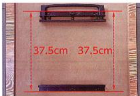
図3 レールどうしの間隔が約 37.5cm であることを確認します。

図2 レールをテーブルの下に置いてからレールに沿って線を引き、しるしをつけます。