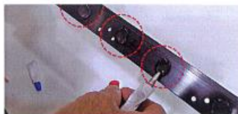
図4 同梱されている強力接着剤 A をレール上に図 4 上のように塗ったら、同じ場所に違う色の接着剤 B を同等量塗ります。