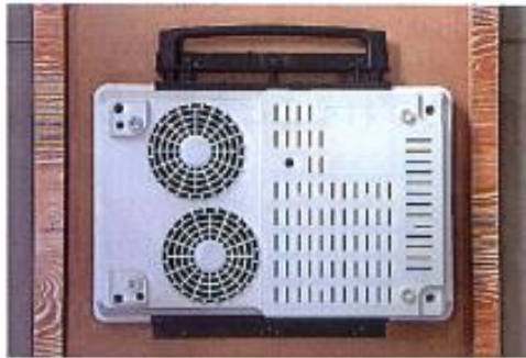
図1 製品を取り付けるテーブルの下に製品のサイズに合わせてレールの位置を決めます。