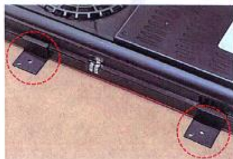
図3 固定金具をスマートアンダーレンジの両側面にセットし、電動ドリル等で4箇所に付属のネジにて本体を固定させます。

図2 テーブルのたて、よこの長さを測定した後、中心点を基準にして、設置する位置にスマートアンダーレンジを置きます。