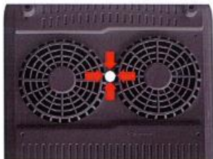
図1 スマートアンダーレンジの底面の2つのファンの間にある表示部分が中心になります。