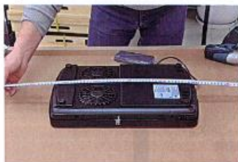
図2 テーブルのたて、よこの長さを測定した後、中心点を基準にして、設置する位置にスマートアンダーレンジを置きます。

図1 スマートアンダーレンジの底面の2つのファンの間にある表示部分が中心になります。