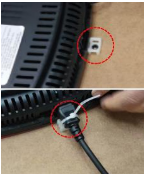
図.4 部品（マウント）をアンダーレンジの電源コードの位置と反対側に密着させて設置し固定させた後、電源ケーブルを結束バンドでもう一度固定します。