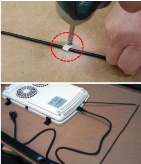
図.6 コントロールパネルをテーブルの端に固定したら、同梱されている止め具でコードを整えて設置を完了します。