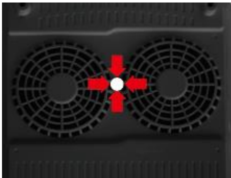
図.1 アンダーレンジ本体の底面にある、ファンとファンの間が中心です。