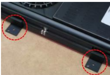
図.3 ブラケットをアンダーレンジの両側面に密着させた後、電動ドリル等で、4ヶ所に付属のネジにて本体を固定させます。