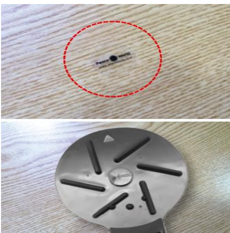
図.7 センターシールを貼るコツ