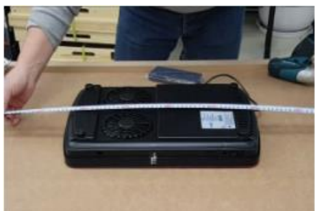
図.2 テーブル横×縦の長さを測定した後、中心点を基準にして、アンダーレンジを置きます。