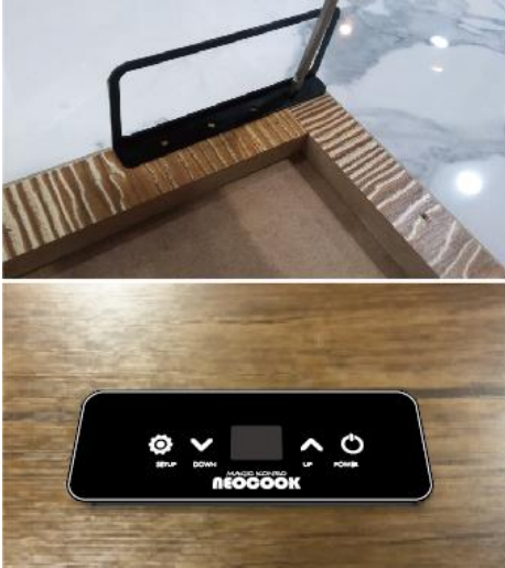
図.5 有線リモコン固定金具をテーブルの端に置き、固定します。 (図上) または、穴明けされた位置に有線リモコンを置いて固定します。 (図下)